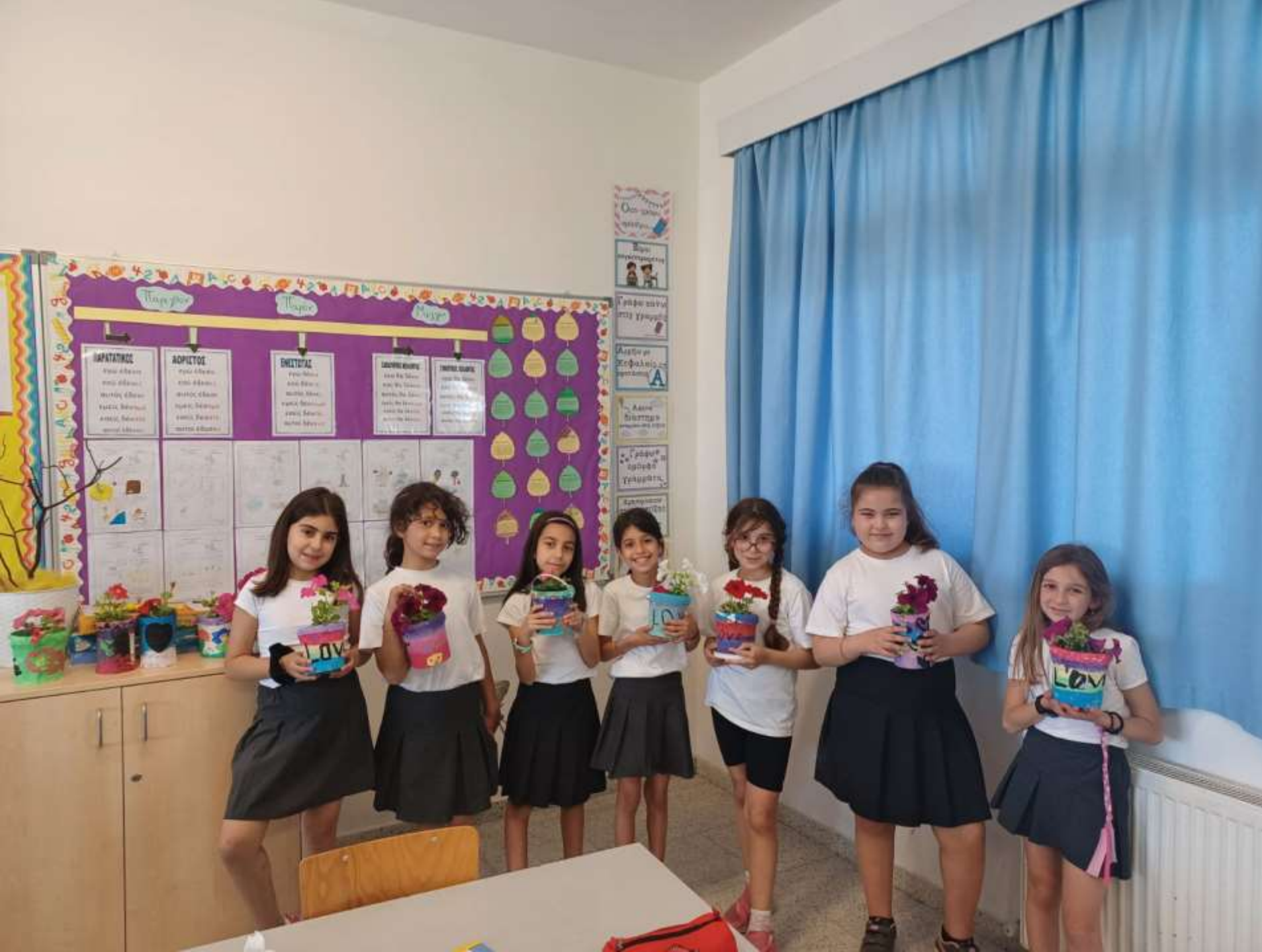
Φυτέψαμε λουλούδια στα γλαστράκια μας.