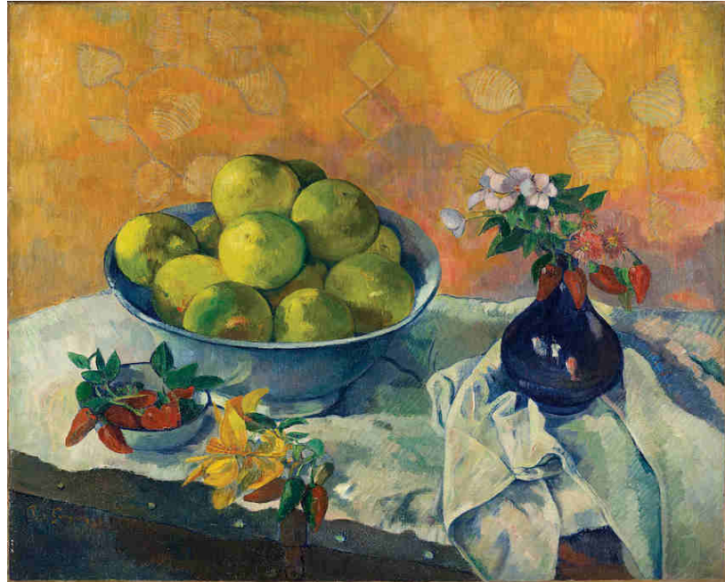
Paul Gauguin- Νεκρή φύση με γκρέιπφρουτ