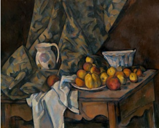
Paul Cézanne Still Life 1905

Ακολουθήστε αυτό το link (σύνδεσμο) το οποίο βρίσκεται στην ιστοσελίδα του μουσείου National Gallery of Art https://www.nga.gov/index.html