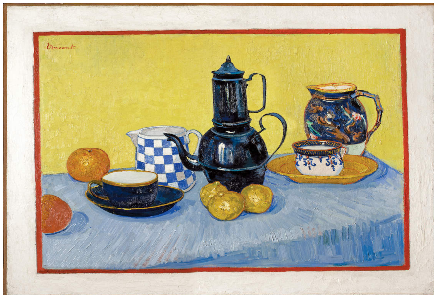
Vincent van Gogh -Νεκρή φύση με καφετιέρα