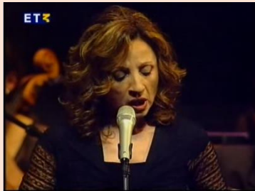
Η ζωή εν τάφω - Γλυκερία