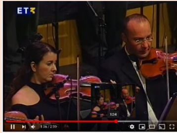
Αίσιον εστί - Γλυκερία