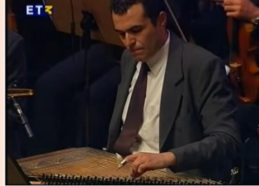
Αι γενεαί πάσαι - Γλυκερία

Αποσπάσματα από την παράσταση «Από το Πάθος στην Ανάσταση», που παρουσιάστηκε στο Μέγαρο Μουσικής Θεσσαλονίκης το 2005. Συμμετέχει η Συμφωνική Ορχήστρα Δήμου Θεσσαλονίκης. Μαέστρος ο Πάρης Γκούνας.